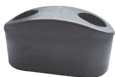
paracolpi tipo bombato