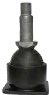
MOLLA CONICA PRIMARIA a base rettangolare