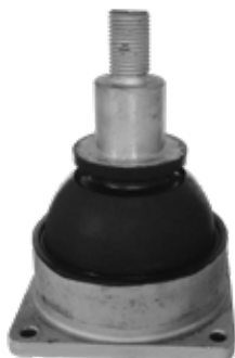
MOLLA CONICA PRIMARIA a base quadrata