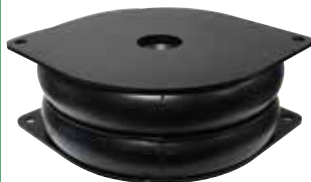
MOLLA SOSPENSIONI SECONDARIE misure \varnothing 410 X h160 foro 75