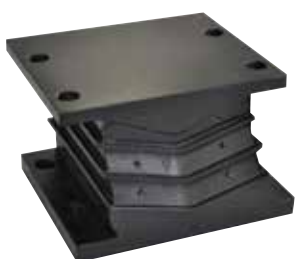
MOLLE E "V" TIPO CHEVRON misure 130 x h96 x 160