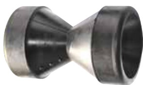
MOLLA CLESSIDRA FERROVIARIA