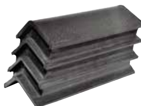
MOLLA A V TIPO CHEVRON V 1200