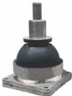
MOLLA CONICA PRIMARIA a base quadrata