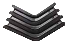
MOLLA A V TIPO CHEVRON V 236