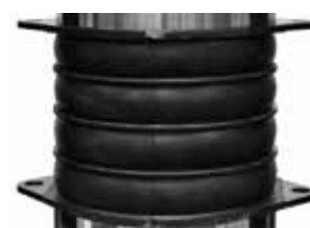
MOLLA SOSPENSIONE ELEMENTI IN GOMMA misure 203 x h160 foro 35