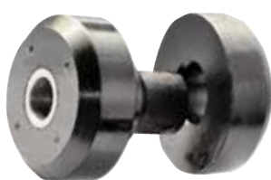
ANTIVIBRANTE A TELAIO FERROVIARIO