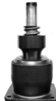
MOLLA CONICA PRIMARIA a base rettangolare