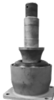
MOLLA CONICA PRIMARIA a base quadrata