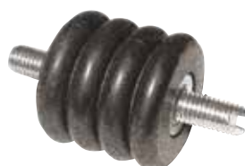
SUPPORTO ANTIVIBRANTE misure \varnothing 43