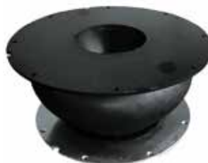
MOLLA SOSPENSIONE misure 420 x h190